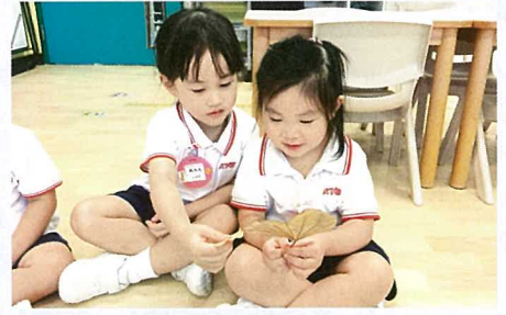
▲ 課堂上，學生們爭相觀察枯葉。