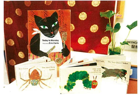
當介紹藝術家時，如艾瑞卡爾，學校會購買整個系列，讓學生更認識其作品。

由於救恩學校幼稚園部與小學部是相鄰而建，在設計的實用性上，兩者都有不少共用的地方，如：3樓的學習中心，有不同種類的圖書，適合老師、小學部、幼稚園部的學生；6樓的綜藝館，可以讓學生玩遊戲或舉辦活動等，給予一個萬用空間，讓幼稚園部及小學部的學生使用；6樓亦設有空中花園，提供學生戶外活動的空間。