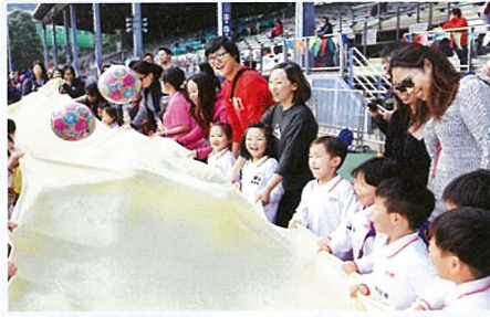
▲ 學校舉辦親子活動，所有人都玩得不亦樂乎。