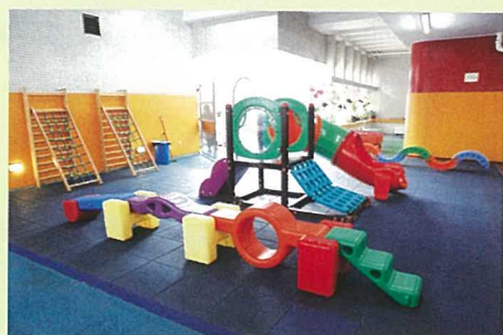
6樓的空中花園，設有不少訓練學生大小肌肉的設施。