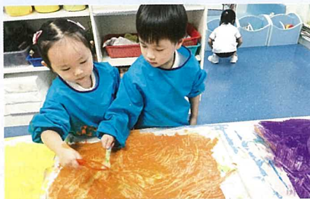
▲ 就不同題目，學生會一同設計藝術作品。