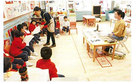
▲ 家長義工正教授學生寫毛筆字，藉以引起他們對書法的興趣。