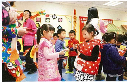
▲ 學生穿上華服回校，投入參與「我愛中國」的專題研習。