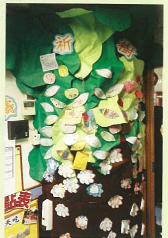
幼稚園入口處有祈禱樹，學生可以寫下遇到的困難，讓師生一同祈禱。