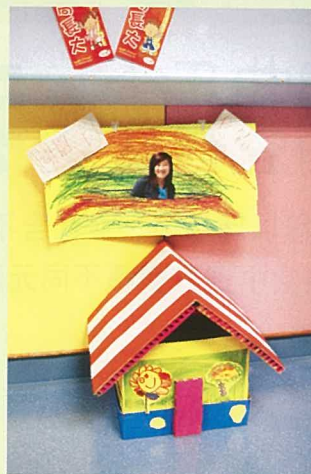
教職員辦公室的門外，放置了「關園長信箱」，學生可將寫的信或問題放置其中。