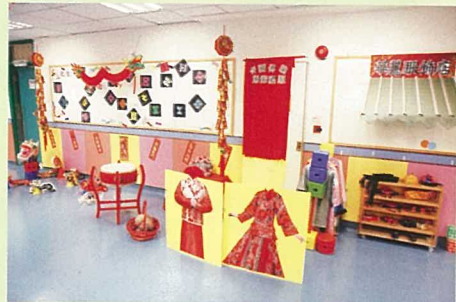
就不同的專題研習，老師會在學校切換不同的佈置。