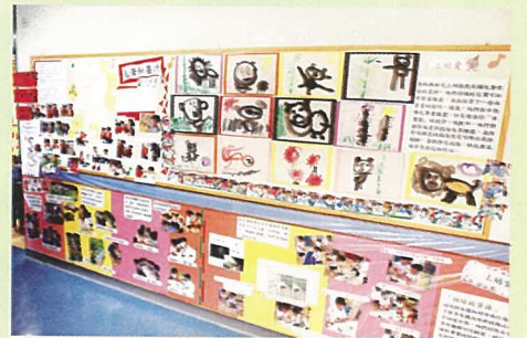
學生的作品會在學校的不同地方張貼，有助增強學生的自信心及歸屬感。