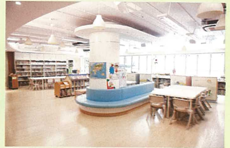
3樓的學習中心擁有逾30,000本圖書，幼稚園部及小學部的學生均可使用。