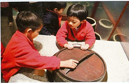
▲ 學生外出參觀，研究中國歷史。