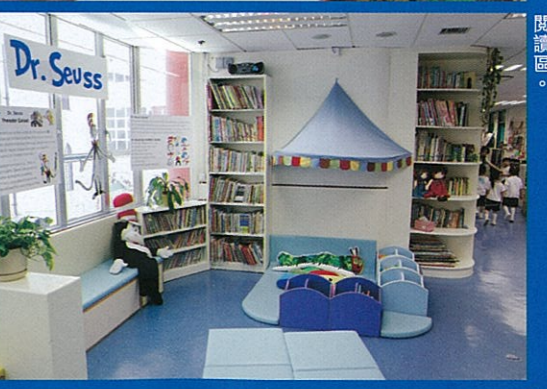
該校處處書香，這是校舍內其中一個小小閱讀區。