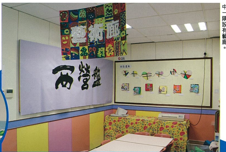
校方很重視培養小朋友對藝術的興趣，校舍其中一間設有藝廊。

其次，救恩學校(幼稚園部)的另一特色，是他們採用小班教學，她們平均每班24至26人，老師把小朋友分為兩組，然後按他們的興趣分成小組進行學習，這樣小朋友便能有更多機會表達意見，老師亦能對小朋友更為關顧。