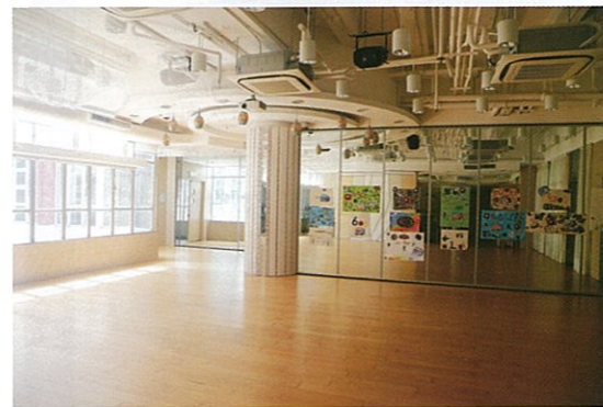
多元用途室，適合進行大小不同的活動。