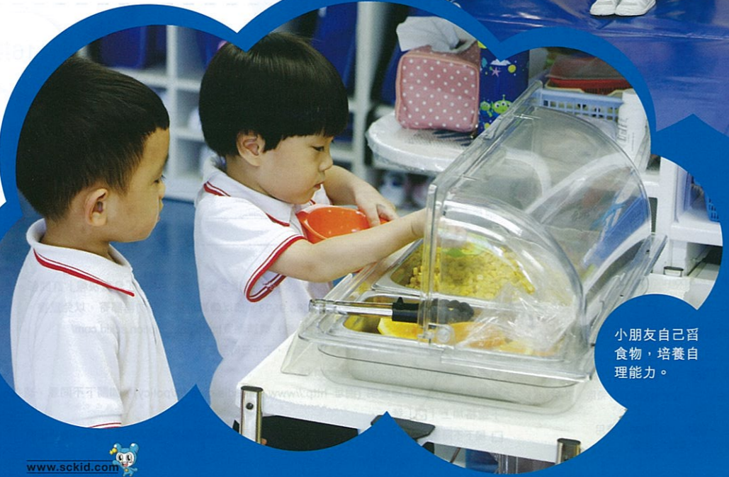
小朋友自己舀食物，培養自理能力。