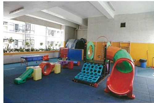
天台的半戶外遊樂場，小朋友很喜歡在此玩耍。