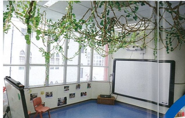
此乃語言室，當上英文課時，老師便會帶領小朋友到此上課。