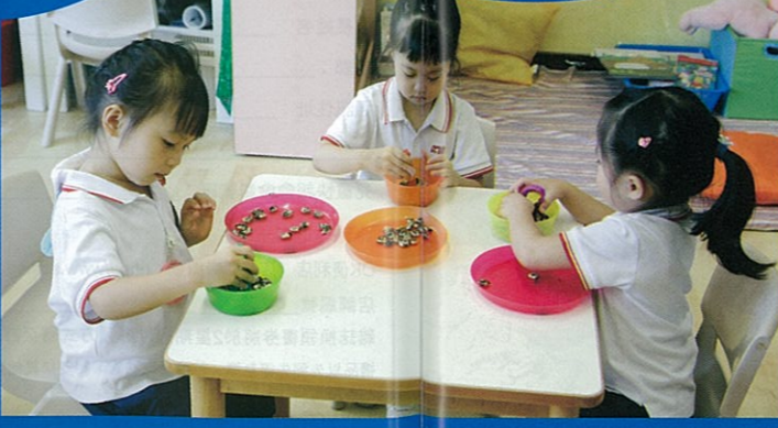
小朋友用鉗子夾蠶豆，提升手眼協調能力。