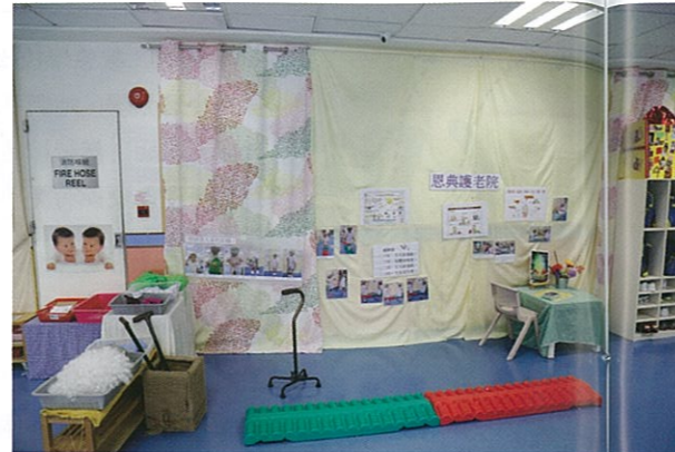
進行社區參觀後，小朋友因應所觀察，設計了一所老人院。

這樣把小朋友分為小組，能夠讓他們有更多表達的機會，學習可以更深入，老師亦可以增加對他們的了解，因應個別的能力作指導。進行活動時，除了有老師外，亦有助教協助，增加對小朋友的關顧。」