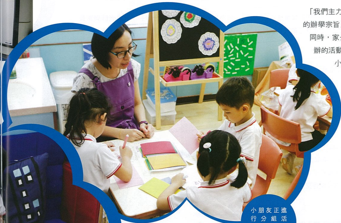
小朋友正進行分組活動，他們在繪圖。