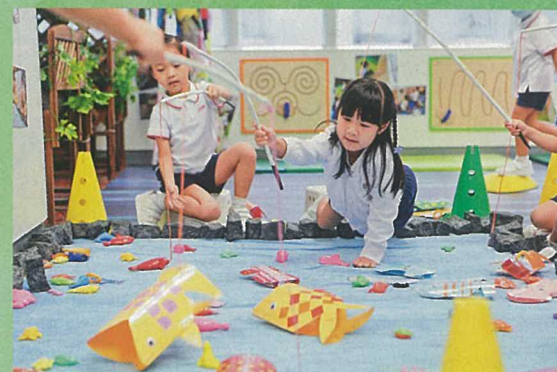
▲小朋友在「魚樂無窮」活動中，訓練手眼協調。

《幼稚園教育課程指引》(2017)提及：「不應安排就讀幼兒班的學童執筆寫字，低班及高班幼兒也不應進行機械式的抄寫和計算活動……」關園長指：「要小朋友畫一條線需要很多能力配合，既要手眼協調、眼球肌肉運用，也要有空間協調。幼兒班沒有寫字訓練，卻有一系列手眼協調活動，如捏陶泥，到下學期會加入線條和空間練習，為小朋友日後寫字作準備。」低班及高班的幼兒以日記形式將每日活動記錄，初期以圖畫記錄為主，之後逐步加入筆畫、部件、部首和文字結構的概念，幫助幼兒增加對文字的認識和記憶，他們慢慢能書寫出數字和文字，到畢業前一般已能書寫約60字的日記。幼兒班進行大量閱讀及接觸環境中的文字，低班和高班亦繼續以圖書建構對文字的概念。學校設有閱讀區及圖書館，擁有多達15,000本圖書，供小朋友借閱，同時安排混齡閱讀，讓低班的小朋友講故事給高班的哥哥姐姐聽，他們毫不怯場，講起來充滿信心。