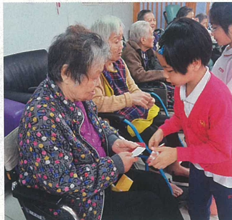
▲ 學校重視品德培育，定期安排小朋友參與社區服務，如探訪老人院。