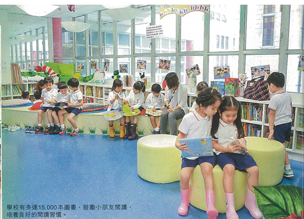
學校有多達15,000本圖書，鼓勵小朋友閱讀，培養良好的閱讀習慣。