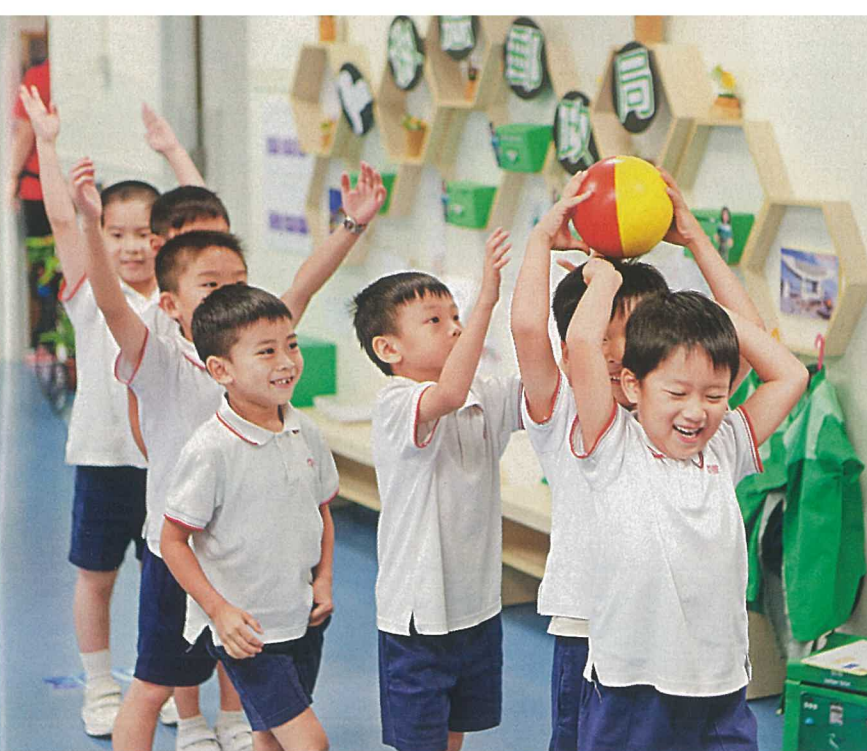
▲學校重視以音體美課程，發展小朋友各方面潛能。圖為高班小朋友進行體能活動。