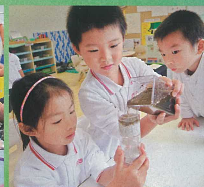
▲專題研習配合多元化活動，如實地考察、參觀、訪問、實驗等，鼓勵小朋友從探索中學習。