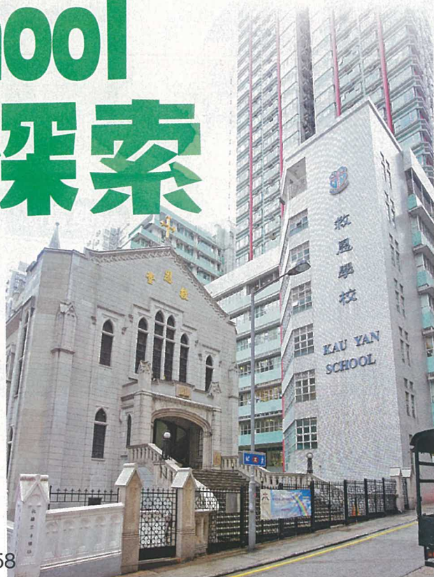
救恩幼稚園部及小學部均於同一校舍，有效加強幼小聯繫。

●撰文：Irene Lok ●設計：Clara