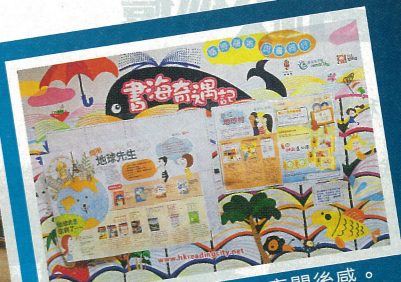
● 閱讀計畫鼓勵學生分享閱後感。