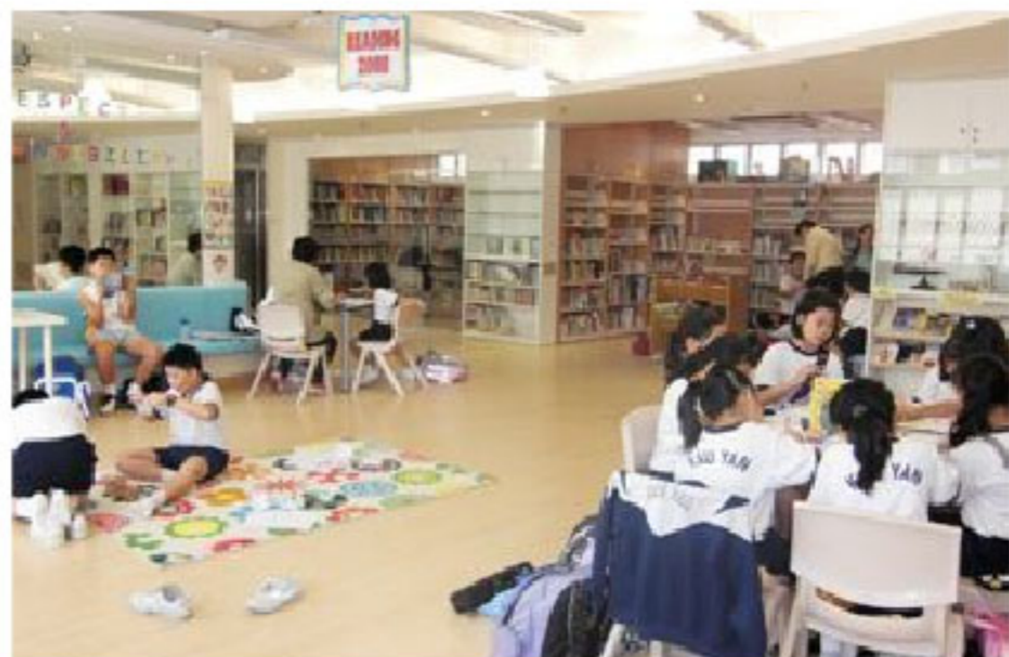
▲ 「學習中心」(Learning Centre)

另一方面，學校也培養學生「愛學習」的態度。陳校長表示，學校的學習環境、課程設計等都以提升學生的學習興趣為目標，例如採用分組學習，在常識科上增加探究項目，以及讓學生在週一及週五的下午時段參與單元課程，內容包括資訊科技、戲劇、體育、個人及社會教育，目的是透過不同的課程，讓同學能有多元的學習和發展，也使他們更投入在學習之中。