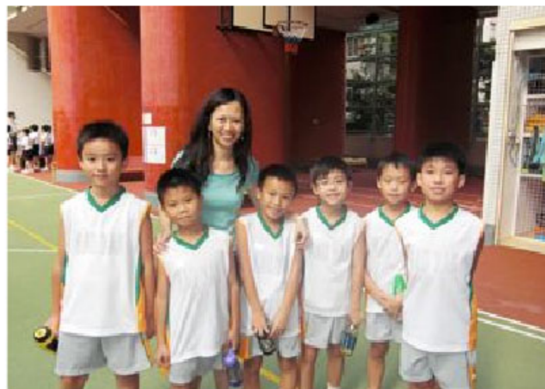
▲ 學生在運動方面非常出色