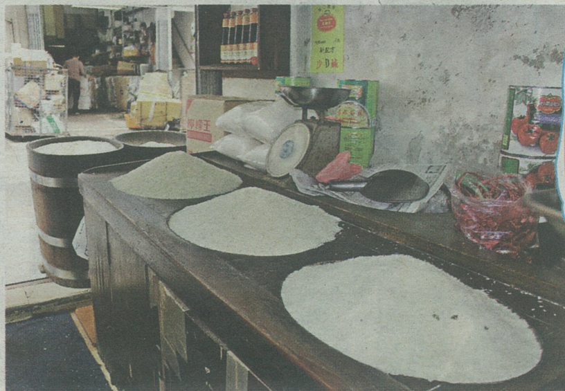
店東鄭先生表示，舊式米舖以「斤」為量度單位。