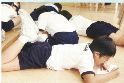
誰說上堂一定要坐定定？