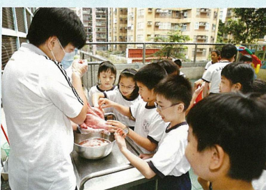
知識並非只記載在書本裏，還要憑觸覺感受出來。