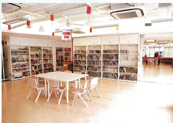
地方寬敞的學習中心給同學們舒適的閱讀及學習環境。