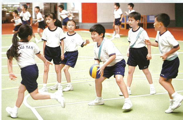
大家團結一致，校園就像是一個溫暖的家。