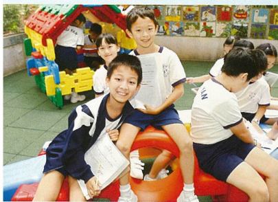
學生在愉快氣氛下學習，課堂充滿着互動及趣味。