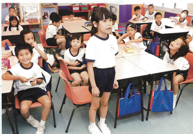
同學踴躍發表見解。