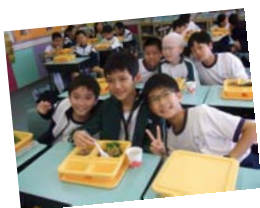
心光學校同學到訪

愛人:透過「獨特的我」活動、服務團隊、社區關懷活動，讓同學效法主，學習關愛幼小，服務他人。